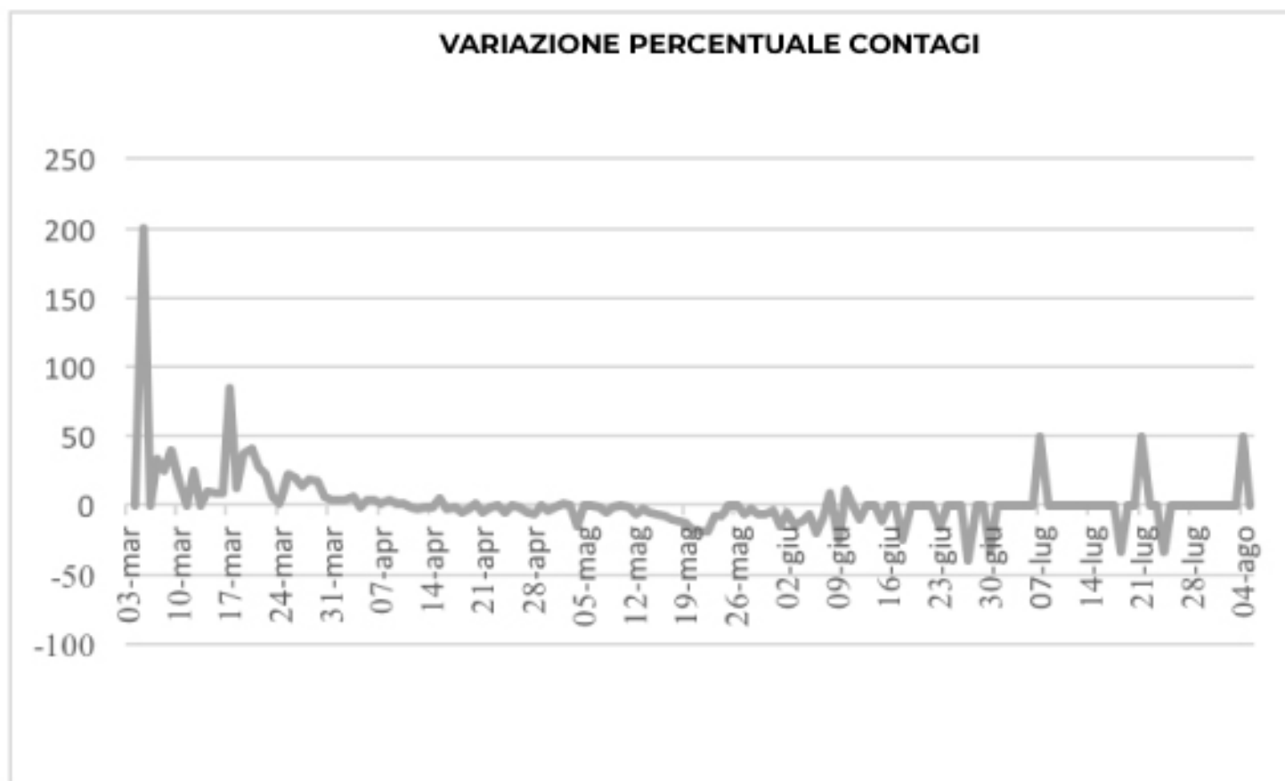
VARIAZIONE PERCENTUALE CONTAGI