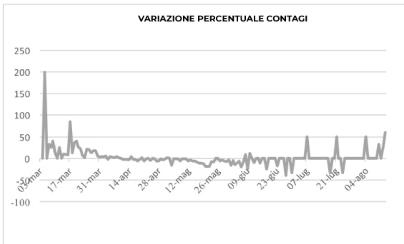
GRAFICO VARIATIONE PERCENTUALE CONTAGI