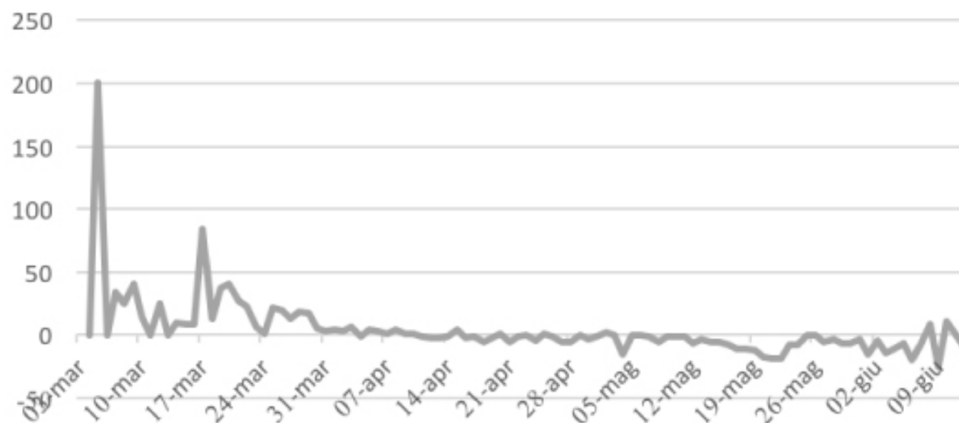
VARIAZIONE PERCENTUALE CONTAGI