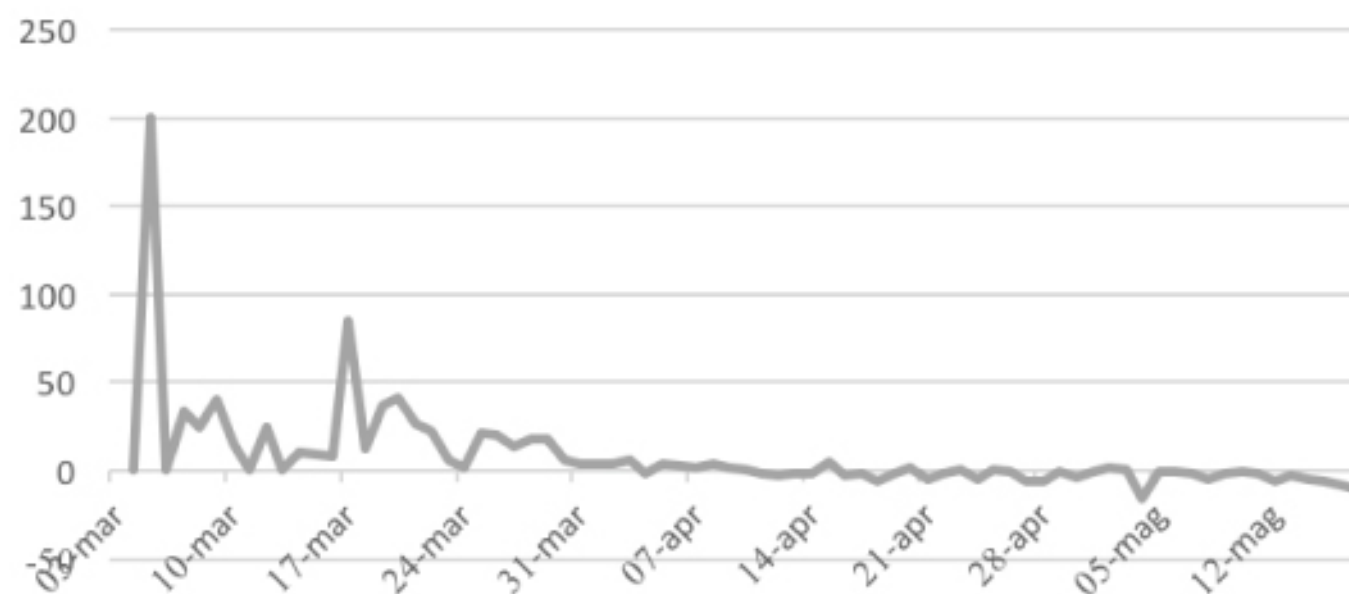
VARIAZIONE PERCENTUALE CONTAGI