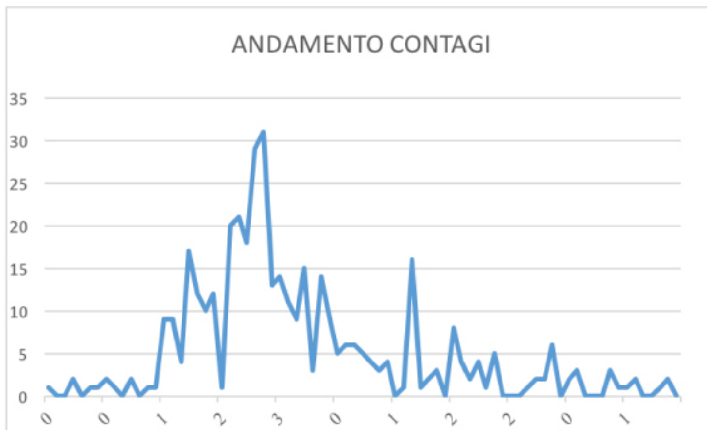
GRAFICO ANDAMENTO CONTAGI