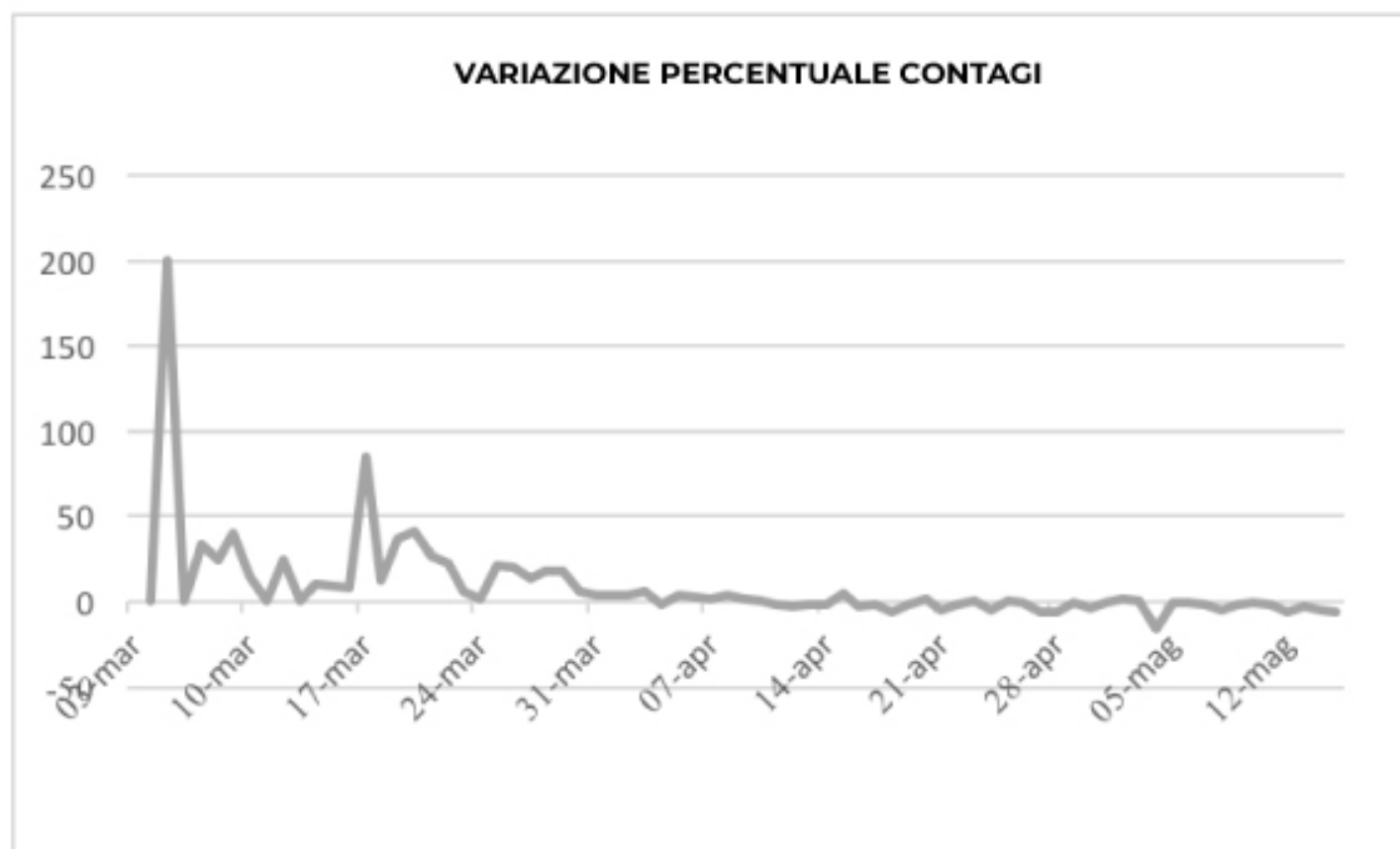
GRAFICO VARIATIONE PERCENTUALE CONTAGI